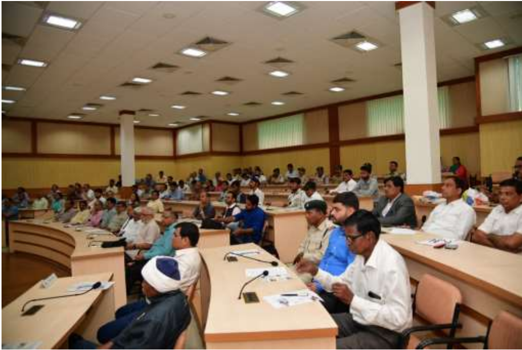
कार्यक्रम में उपस्थित प्रतिभागी