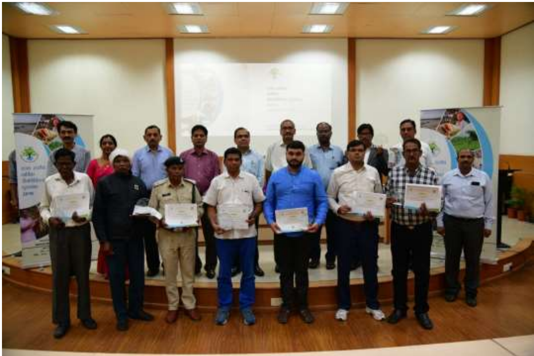
पुरस्कार विजेताओं का समूह फोटोग्राफ