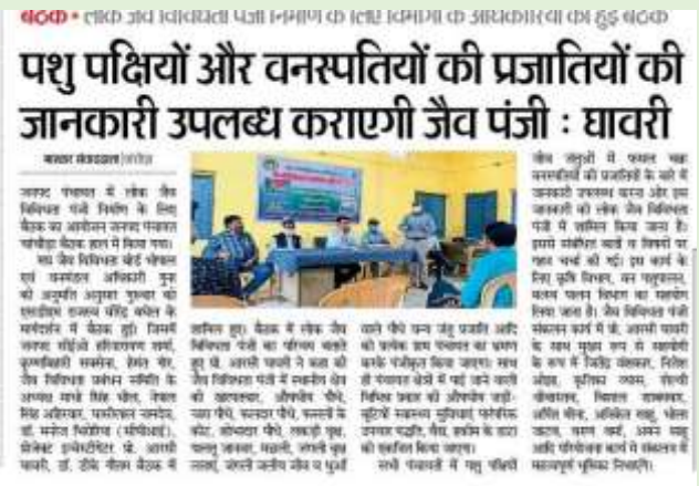
जैवविविधता प्रबंधन समिति जनपद पंचायत – चाचौडा जिला गुना में दिनांक 22.06.2021 को प्रथम बैठक का आयोजन किया गया।