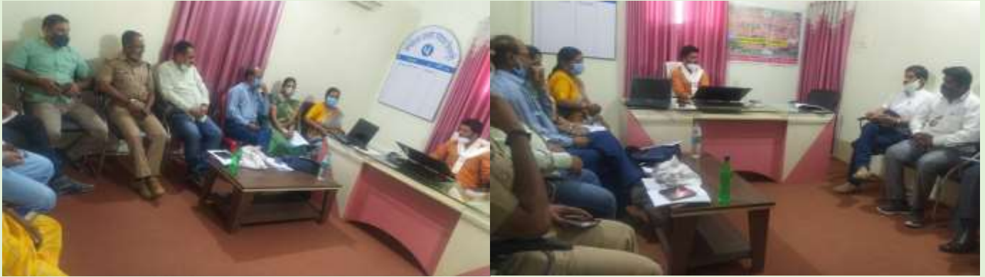
जैवविविधता प्रबंधन समिति जनपद पंचायत– शिवपुरी जिला– शिवपुरी की प्रथम बैठक दिनांक 01.04.2021