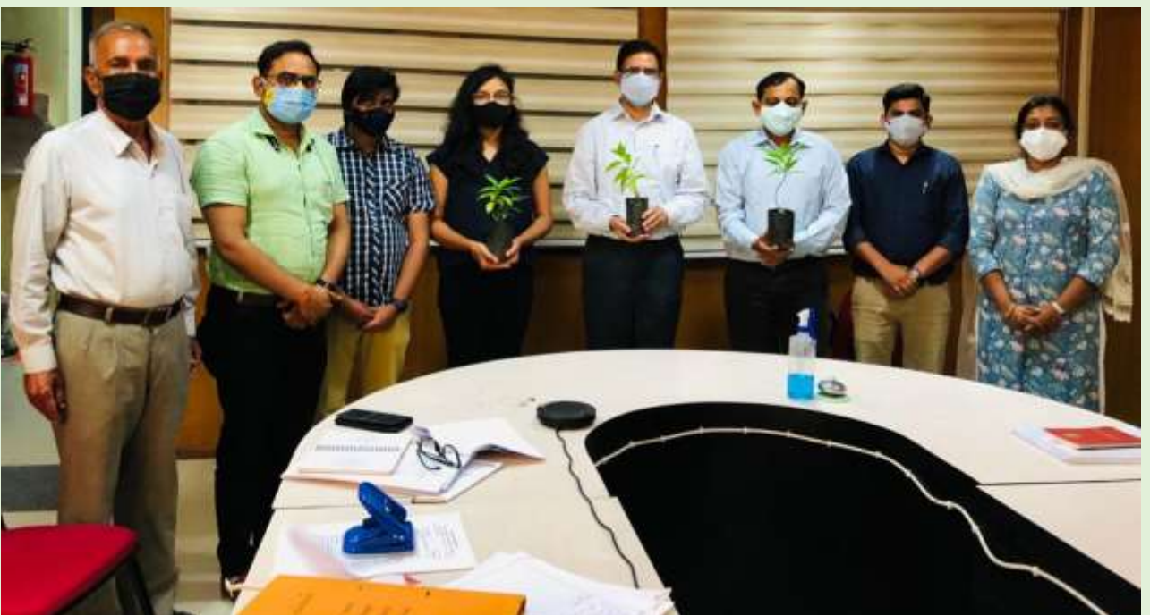
कैरियर कॉलेज, भोपाल (बायोटेक्नोलॉजी विभाग) के छात्रों द्वारा प्लॉट टिसू कल्चर तकनीकी द्वारा तैयार किया गया अडुसा का पौधा मध्यप्रदेश राज्य जैवविविधता बोर्ड को भेंट किया गया।